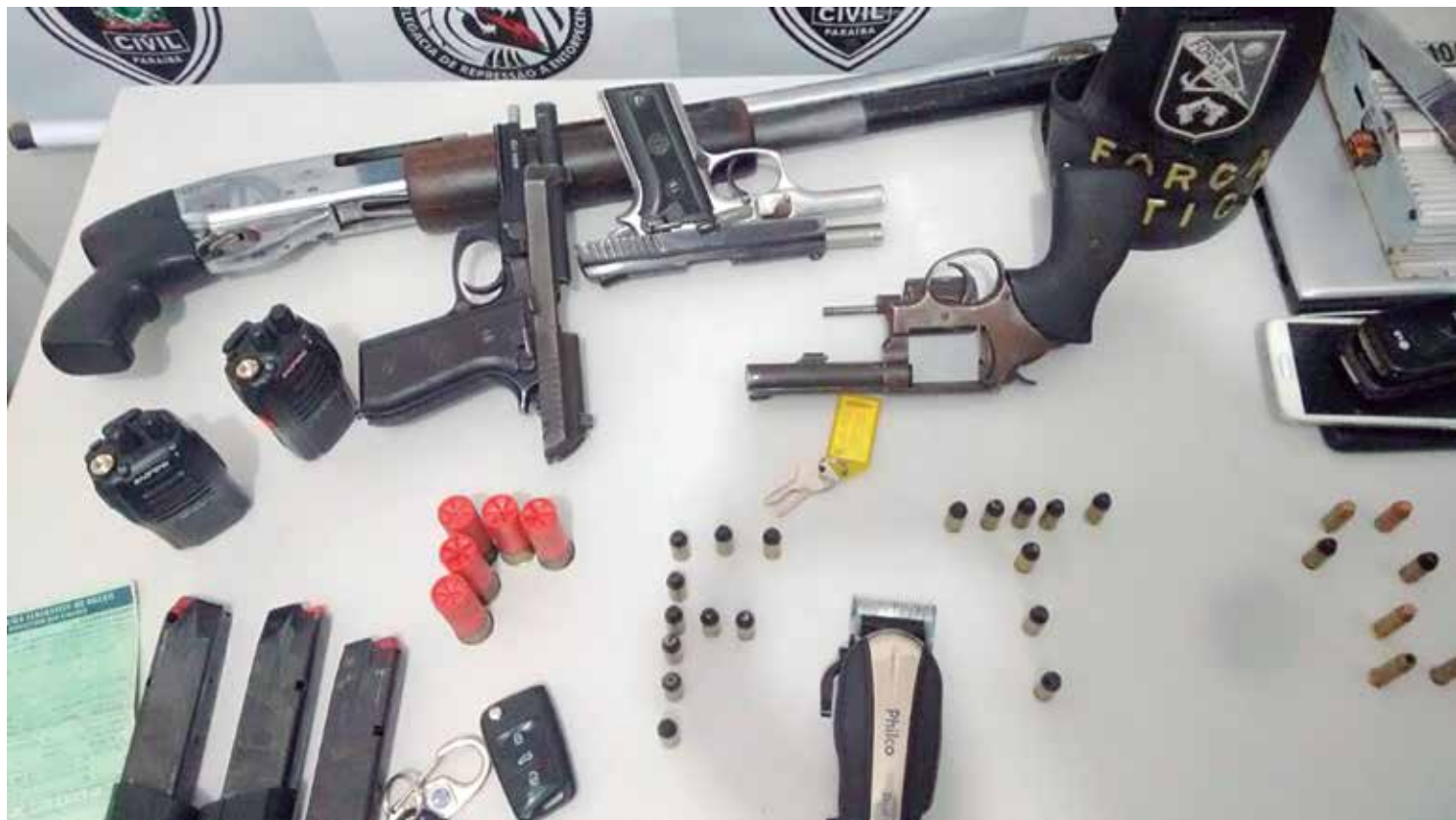
Dois pistolas, um revólver, uma espingarda, munições e dois radiocomunicadores foram apreendidos durante a ação policial em CG