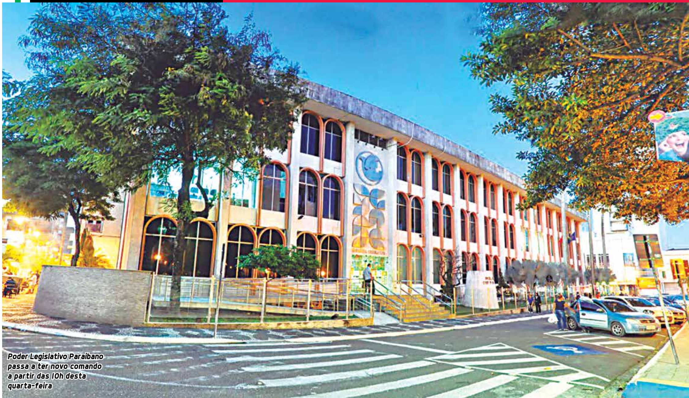
Poder Legislativo Paraibano passa a ter novo comando a partir das 10h desta quarta-feira