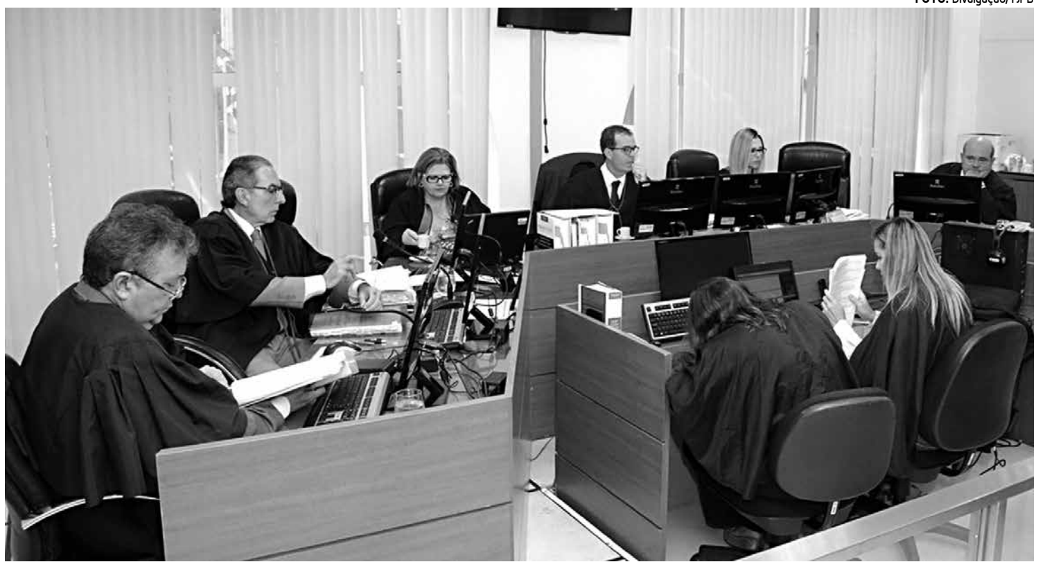
Juiz Ricardo Vilar aponta manobra contábil ao fatiar o processo em contratos em vez de realizar em apenas uma licitação

Na sentença, o Juízo da 1ª Vara da Fazenda Pública da Capital reconheceu a ilegalidade das contratações realizadas sem o processo licitatório e condenou os dois ex-gestores ao ressarcimento integral do dano, no valor de R$ 506.700,00, além da perda da função pública, suspensão dos direitos políticos pelo prazo de cinco anos, pagamento de multa civil no valor de cinco vezes o valor da remuneração recebida na época, dentre outros.