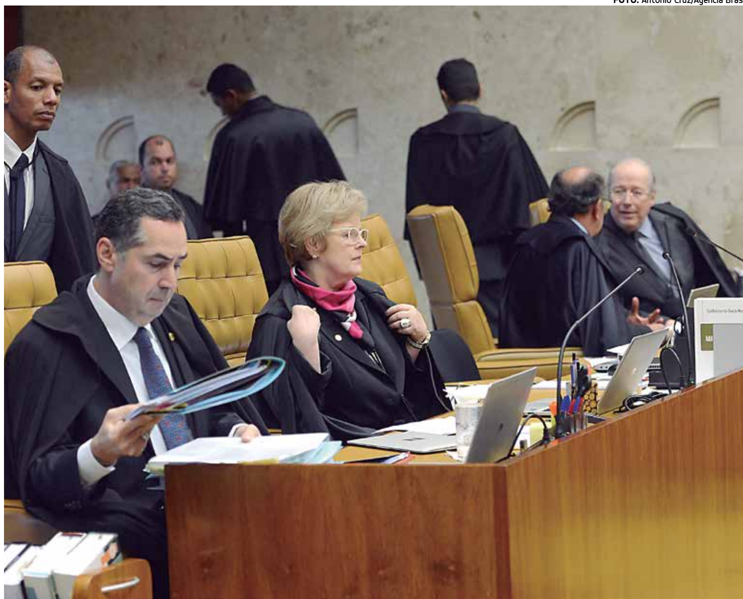
Supremo Tribunal Federal realiza hoje reunião administrativa entre os ministros para definir o formato para a escolha do novo relator

O novo relator será o responsável por tirar ou não o sigilo dos depoimentos dos 77 executivos e ex-executivos da Odebrecht que fecharam acordo de colaboração. Cár-