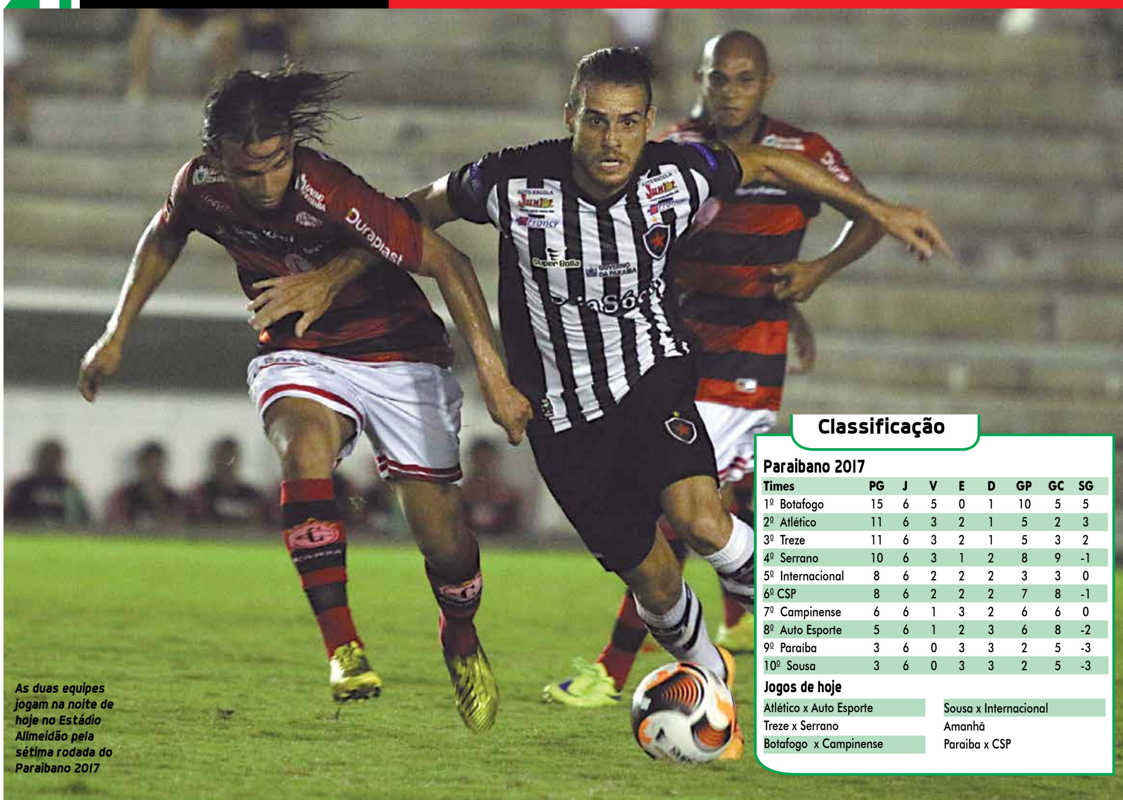
As duas equipes jogam na noite de hoje no Estádio Almeidão pela sétima rodada do Paraibano 2017