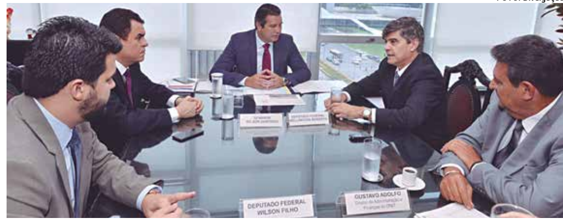
Maurício Quintella virá assinar a Ordem de Serviço para a construção da terceira faixa da BR-230