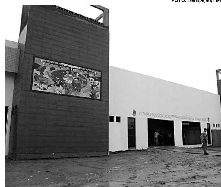
Valor da obra foi liberado pelo governador Ricardo Coutinho